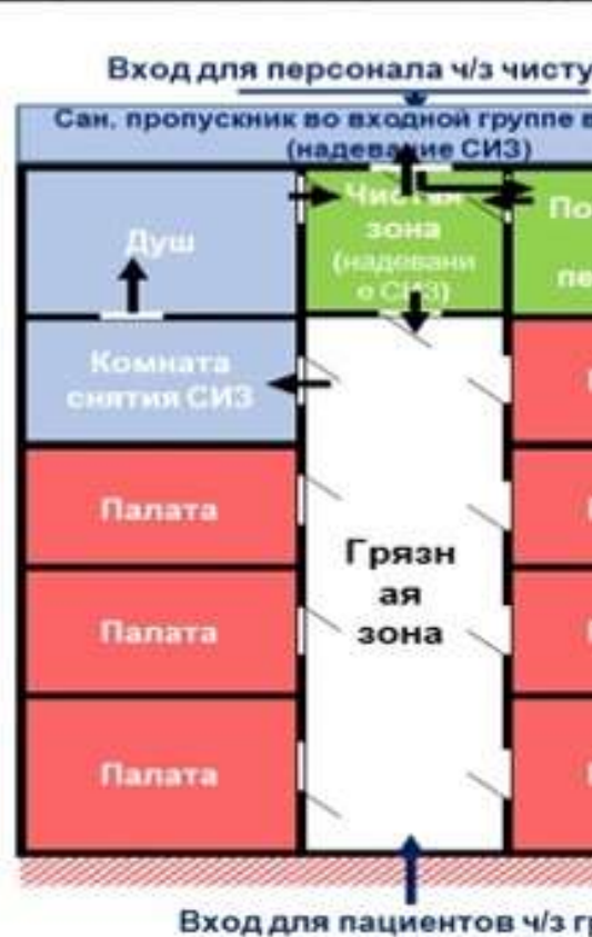
Схема модульного инфекционного стационара